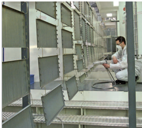
Die Pulverkabine besteht aus einer Handbeschichtungszone, einer vollautomatischen Kabine mit acht elektrostatischen Pistolen sowie einer zweiten Handbeschichtung.

Vor diesem Hintergrund fiel die Entscheidung in eine neue Anlage zu investieren, mit deren Planung und Realisierung das Unternehmen die Firma Ideal-Line beauftragt hat. Die Beschichtung beginnt jetzt mit einer 3-stufigen Vorbehandlung, die folgende Prozessschritte beinhaltet: Entfetten und Nanokeramik (Beckenvolumen 6600 l), Spülen (Beckenvolumen 2600 l) und VE-Spüle (2600 l). „Wir